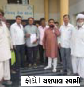
ફોટો | યશપાલ સ્વામી

(સ્પેશિયલ ન્યૂઝ) પાટણ, તા.૨૩ પાટણ જિલ્લા કલેક્ટરને અપ યેલા રીમાઈન્ડ આવેદન પત્રમાં તેઓએ જણાવ્યું હતું કે રામનગર વિસ્તાર ના લોકો ના પ્રશ્નો બાબતે અગાઉ તારીખ ૧૯-૦૩-૨૦૨૨ ના રોજ આવેદન અપાયું હતું તે સંદર્ભ માં આજદિન સુધી કોઈ નોંધ પાલિકા તંત્ર દ્વારા લેવામાં આવેલી નથી અને કોઈ કાર્યવાહી પણ કરવામાં આવી નથી તો રામનગર વિસ્તાર ના લોકો ને તેમના રહેઠાણ ની જગ્યા એ સત્વરે સનદી (પ્રોપર્ટી કાર્ડ) આપવામાં આવે તેમજ વિસ્તારમાં પ્રાથમિક સમસ્યાઓ જેવી કે ગટરોના જોડાણ કરાવી ઉભરાતી ગટરો ની સમસ્યાનો નિકાલ કરવા તેમજ દરેક ચાલીમાં પાકા રોડ રસ્તા, પીવાના પાણીની સમસ્યા નું નિવારણ લાવવા, સફાઈ કામગીરી હાથ ધરવા જેવી રજૂઆત કરવામાં આવી હોય અને જો ઉપરોક્ત સમસ્યાઓ નું ઠિન પંદરમાં નિવારણ લાવવામાં નહિ આવે તો વિસ્તારના લોકો ને સાથે રાખી કલેક્ટર કચેરીએ ભુખ હડતાળ ઉપર બેસવાની ચિમકી આપી હોવાનો ઉલ્લેખ કરવામાં આવ્યો હોવાનું જાણવા મળ્યું છે.