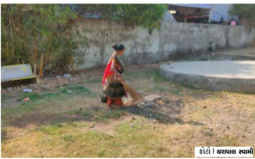
ફોટો | યશપાલ સ્વામી

ફોટો | યશપાલ સ્વામી (સ્પેશિયલ ન્યૂઝ) પાટણ, તા.૨૩ પાટણ જિલ્લામાં અકસ્માતોના બનાવ વધી રહ્યા છે. ત્યારે પાટણ શિહોરી હાઈવે નજીક બાઈક અને ઈકોની ગાડી વચ્ચે અકસ્માત સર્જાયો હતો જેમાં બાઈક ચાલકનું ઘટના સ્થળે મોત થયું હતું. પાટણ શિહોરી હાઈવે નજીક મોડી રાત્રે બાઈકના ચાલક અને ઈકોની કાર વચ્ચે અકસ્માત સર્જાયો હતો. જેમાં કાંકરેજ તાલુકાના રાનેર ગામના બાઈક ચાલકનું મોત નિપજ્યું હતું. અકસ્માતની જાણ પોલીસને થતા ઘટના સ્થળે પહોંચી તપાસ શરૂ કરી હતી. પોલીસ દ્વારા મૃતકની લાશનું પંચનામું કરી પીએમ માટે ખસેડી આગળની કાર્યવાહી હાથ ધરી હોવાનું સૂત્રોએ જણાવ્યું હતું.